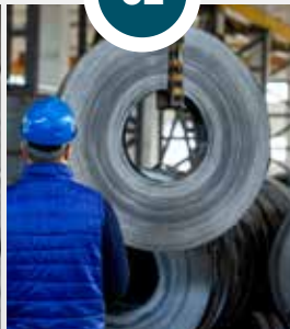
HIERRO Y ACERO